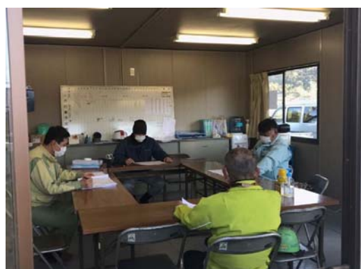
【写真④】対面距離の確保