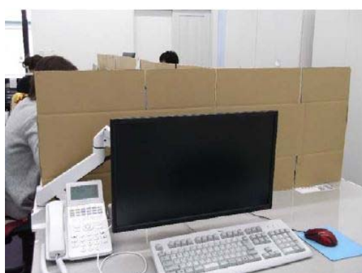
【写真⑤】パーティションによる密接防止